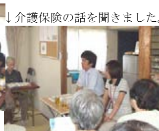
↓介護保険の話の聞きました。