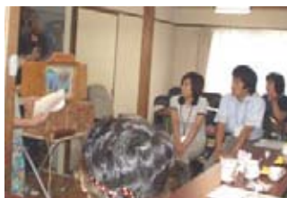
↑紙芝居をみました。

9月13日（木）に開かれた「さんさんサロン」では、介護保険の話の聞いたり、紙芝居を見たり、お茶を飲みながら皆さんでおしゃべりしたりと、楽しく過ごされました。